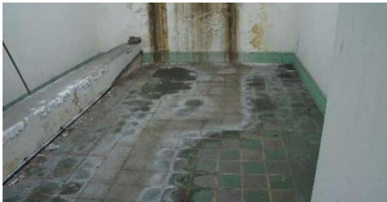
Humedades en sótano

Dentro del presente estudio se observaron diversas afectaciones que se demuestran con fotografías tomadas en el sitio.