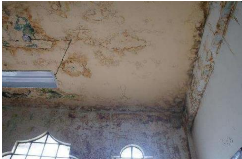
Afectaciones de humedades y manchas en placas de piso 4

En el presente caso, los daños corresponden a daño estructural. Para establecer la condición del daño, se realizaron múltiples recorridos de inspección de todos los pisos del edificio y con ello se establecieron y localizaron las anomalías que pueden asociarse con las causas que las originan.