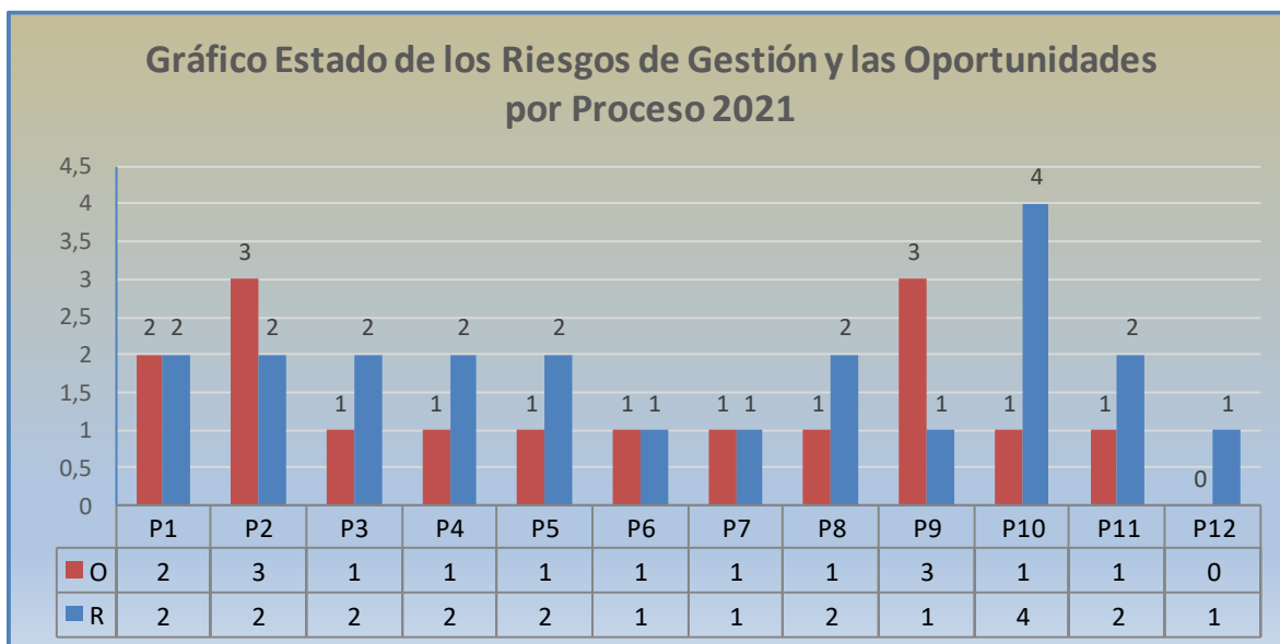
Ilustración 2 Distribución de Riesgos y Oportunidades por Procesos Vigencia 2021:

El Concejo Distrital cuenta con treinta y nueve (39) riesgos y oportunidades en su matriz, pero resulta necesario para su seguimiento y control identificar su distribución en los diferentes procesos de la corporación: