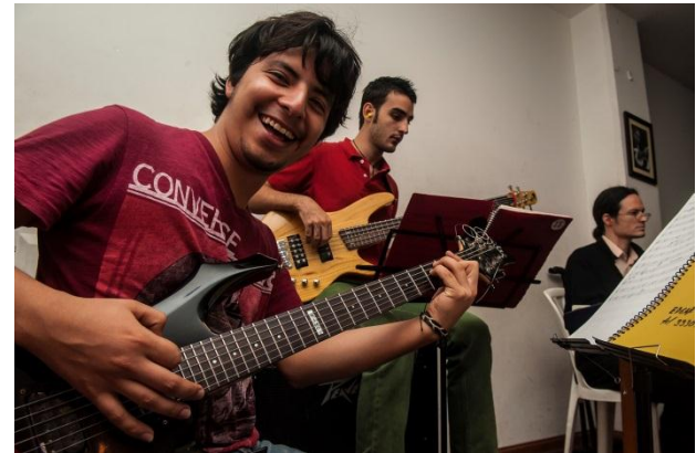
ESCUELA DE MUSICA