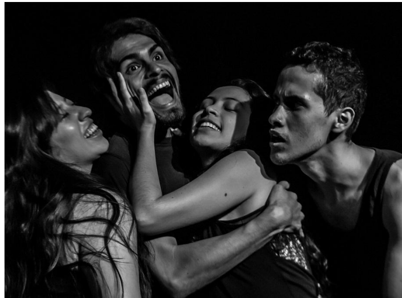
ESCUELA DE TEATRO