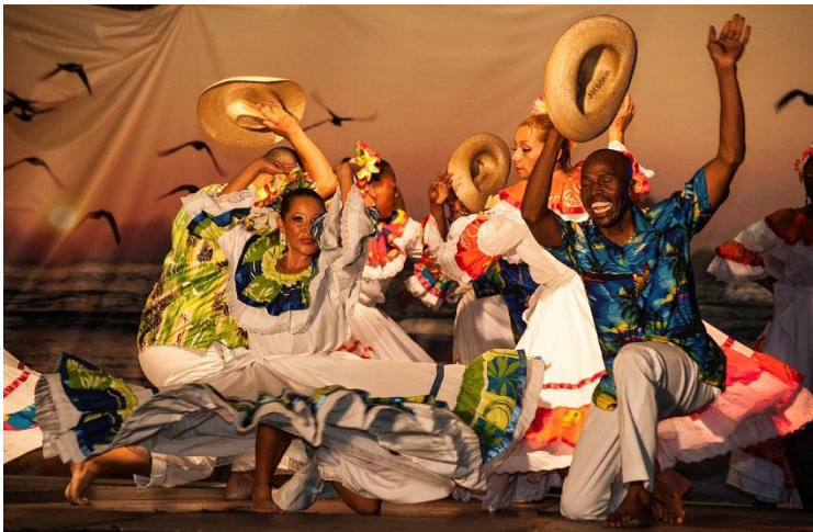
ESCUELA DE DANZAS

En el marco de la transferencia de recursos realizada por la Secretaría de Cultura y Turismo, durante primer semestre del 2013 hasta el 31 de agosto se ha matriculado 559 estudiantes.