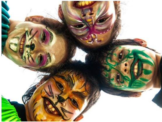
ESCUELA INFANTIL Y JUVENIL DE ARTES INTEGRADAS

Para la consolidación efectiva de procesos culturales sostenibles, orientados al diálogo, el reconocimiento, la creación, investigación, producción, goce cultural y visibilizar diversidad cultural, preservando y divulgando las manifestaciones artísticas, orientadas en el desarrollo regional. El Instituto Popular de Cultura ha desarrollado estas actividades: