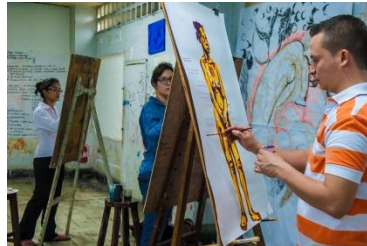
ESCUELA DE ARTES PLASTICAS