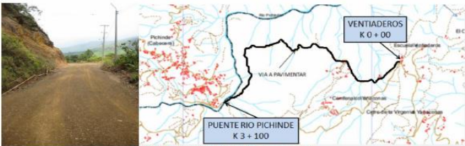
Ilustración 3- Localización Segunda Etapa del Proyecto

Corresponde a las obras ya ejecutadas y que se encuentran en servicio.