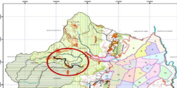
Ilustración 2 - Trazado del Proyecto

Los 8.8 Kilómetros por pavimentar señalados en el punto 1.2. Características de las vías del proyecto, corresponden a tres tramos identificados en el trazado (ver ilustración), que cubren los corregimientos