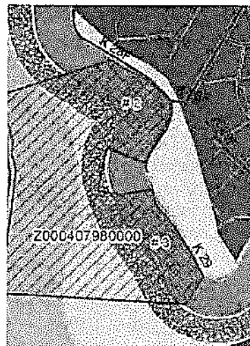
Lote número predial Z000407980000

d. Diseños de adecuación paisajística de la Fase 1, incluyendo levantamiento topográfico, estudio de suelos, costo y presupuesto, manual de operación del proceso para la correcta conformación de la adecuación paisajística. Estos diseños deberán considerar la adecuación de esta franja como espacio público que permita generar un paisaje, que brinde espacios para la práctica de deportes urbanos, recreación activa y pasiva, re-vegetalización de estas áreas, garantizando la estabilidad y adecuado manejo de estos terrenos. El manual de operación del proceso de adecuación deberá establecer los horarios de operación, las zonas de cargue y descargue, así como las áreas para recepción de los RCD en sus diferentes etapas durante su periodo de ejecución, las vías de acceso y protocolos para el adecuado manejo de los RCD. De igual forma, deberá establecer las medidas para garantizar el correcto manejo de la zona