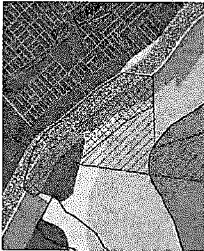
Lote número predial Z000407970000

c. Identificación de fases de intervención y adecuación del parque lineal a ubicar en el cinturón ecológico de Navarro. En este marco, se entenderán como Fase 1, las áreas del cinturón ecológico de Navarro objeto de intervención ubicadas dentro de los predios conocidos como "La Corbata", identificados con números prediales Z000407970000 y Z000407980000 (ver figura).