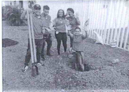
Acciones GPCC Plazas de Mercado 2019

Fecha de la actividad: 28 de mayo, 13 y 26 de junio de 2019