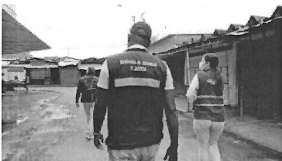
Imagen 3. Recorrido por Santa Elena