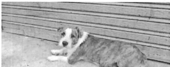
Imagen 1. Luna, canino habitante del Planchón