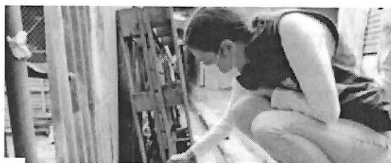
Imagen 2. Felino esterilizado