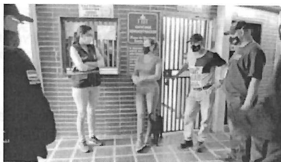
Imagen 4. Hablando personal administrativo a cargo

Se verifica que los animales mencionados anteriormente son alimentados por voluntarios debidamente autorizados por la alcaldía, por personal administrativo de la galería y por algunos propietarios. No se encuentra ningún animal de compañía en mal estado de carnes, excepto un felino enfermo.