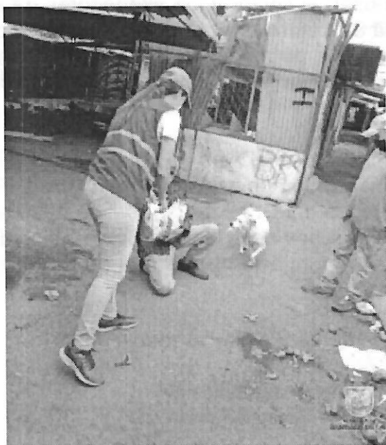
Imagen 5. Entrega de comida a cuidador de Muñeca