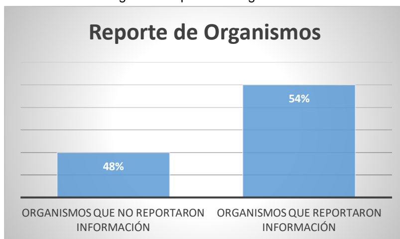
Figura 2. Reporte de Organismos

Fuente: Subsecretaría de Poblaciones y Etnias. Programa para Personas Mayores