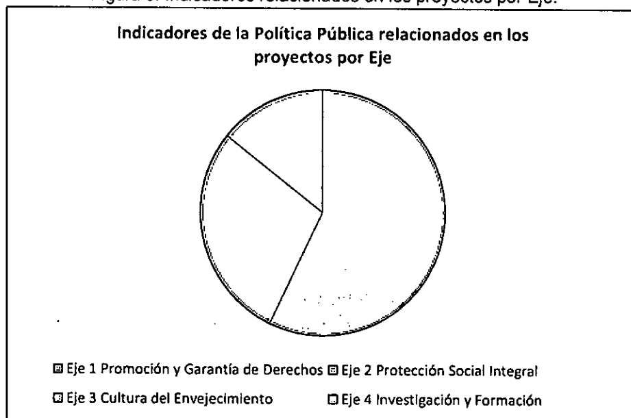
Figura 3. Indicadores relacionados en los proyectos por Eje.