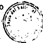
LIBARDO LOZANO GUERRERO Gobernador.