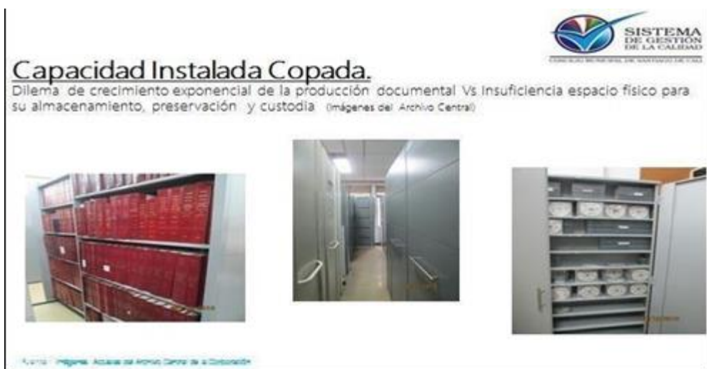
Ilustración 2. Capacidad física del Archivo

Frente a lo descrito anteriormente se concluye que: