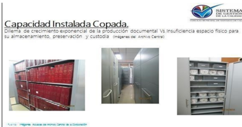
Ilustración 2. Capacidad física del Archivo

Frente a lo descrito anteriormente se concluye que: